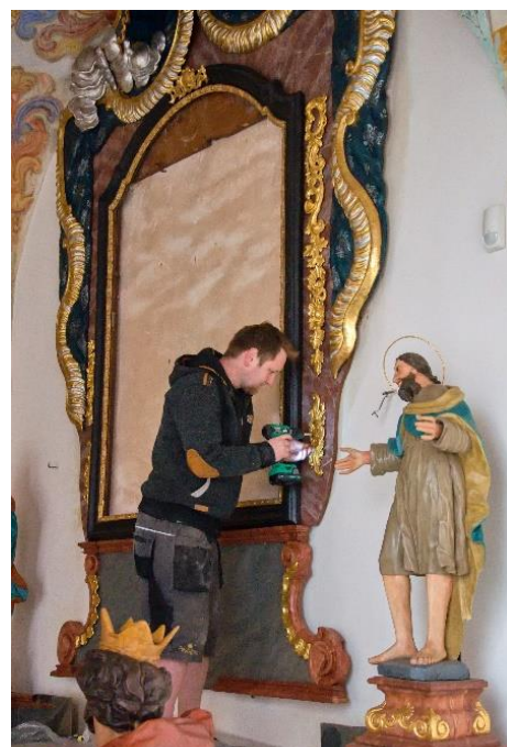
Restaurátoři vrací opravený oltář