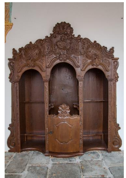
Nově opravená zpovědnice

Ze srdce Vám všem přeji pokoj a radost o vánočních svátcích a mnoho Boží ochrany a požehnání do příštího roku.