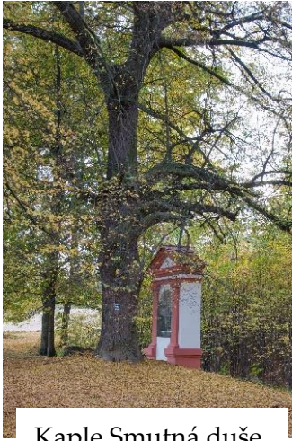
Kaple Smutná duše

buď v nedokončené Loretě, nebo na některém z nově opravených oltářů v ambitech. Do konce listopadu by měly být ukončeny stavební práce na kapličkách. Na jaře se alespoň do části z nich budou vracet kopie soch. Kvůli prudkému nárůstu cen se nejspíš nepodaří vytvořit kopie všech soch a pro výzdobu kaplí bude třeba najít dárce.