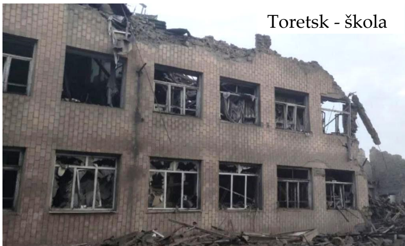
Toretsk - škola

Od začátku války našlo útočiště v Římově osm rodin. Během roku se čtyři z nich přestěhovaly na jiná místa, zůstaly tak čtyři rodiny, z nichž tři bydlí na Sokolovně, a jedna u pana Šilhana v hotelu nad restaurací. Všichni k nám přišli z Doněcké oblasti, hlavního kamene sváru v této válce. Jejich rodné město - Toretsk se nachází v okrese Bakhmut. Nyní asi každý ví o existenci města Bakhmut. Toretsk, - podle počtu obyvatel, jen o pár tisíc lidí menší než České Budějovice – je město horníků. Od dávná se zde těžilo a zpracovávalo uhlí. Nyní je město z devadesáti procent zničeno. Zničeny byly nejen domy, ale i elektrárny, vodárny, podniky, kde pracovali i ti naši přistěhovalci, školy, kde